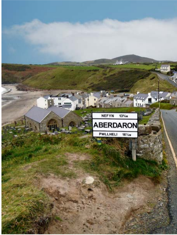
Golygfa dros Aberdaron View over Aberdaron

www.ahne-llyn-aonb.org.uk www.gwynedd.llyw.cymru www.ecoamgueddfa.org