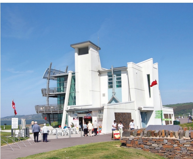
Canolfan Darganfod / The Discovery Centre

Gallwch weld mapiau o'r llwybrau ar www.mbwales.com